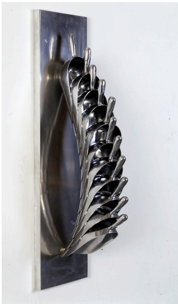
Cascades - Untitled , 2001 117 x 30 x 37 cm