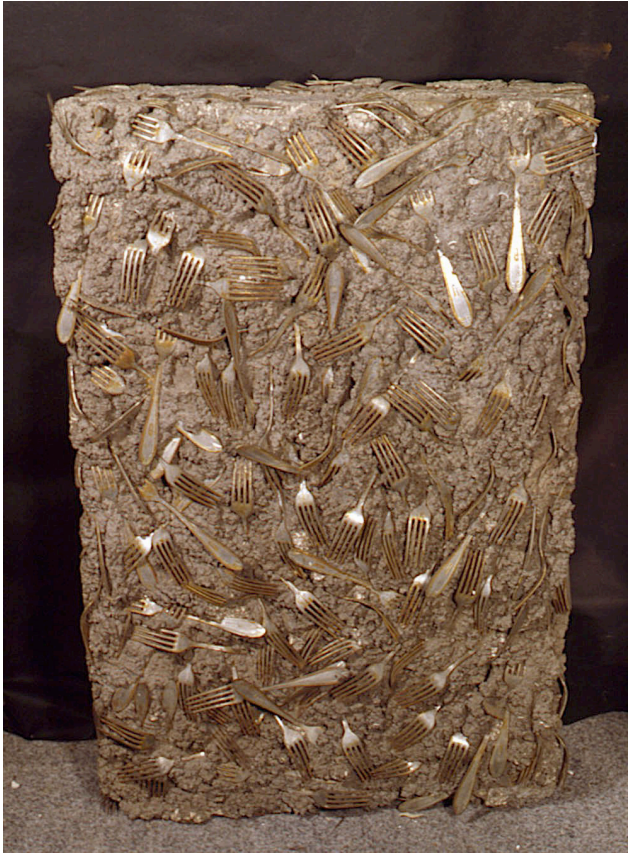
Untitled , 1971 Accumulation de fourchettes dans béton 91 x 63,5 x 20,5 cm Collection Arman Marital Trust