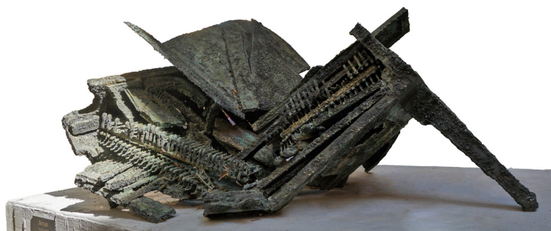
Accord Parfait - Atlantis, 2004