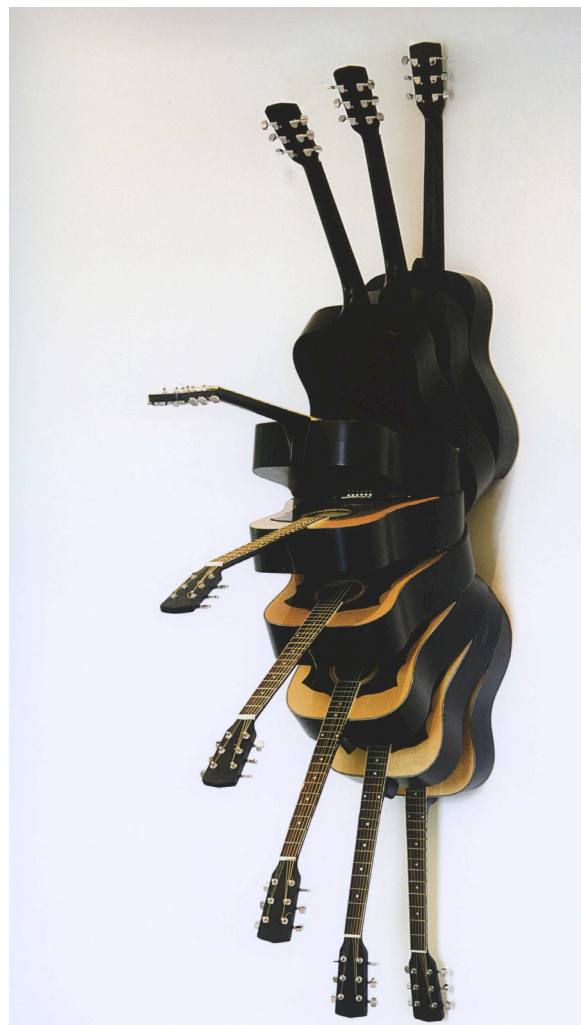
Scaled down , 1996 Accumulation de guitares sur panneau de bois 244 x 41 x 123 cm Collection Arman Marital Trust