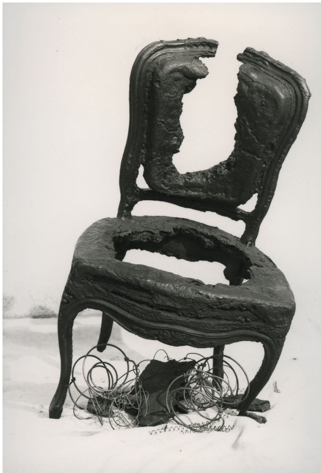
"The day after" , 1984 Bronze Collection Arman Marital Trust