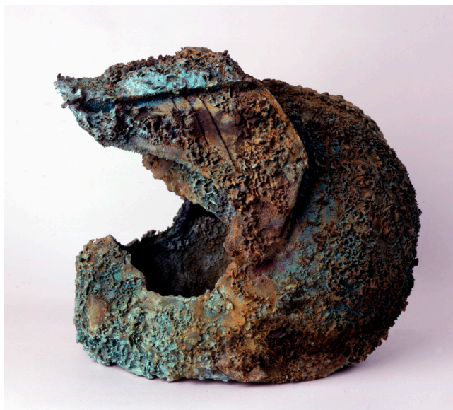
Bol de Bronze , 1991 Casque ouvert en bronze 30 x 27 x 37 cm Collection Arman Marital Trust