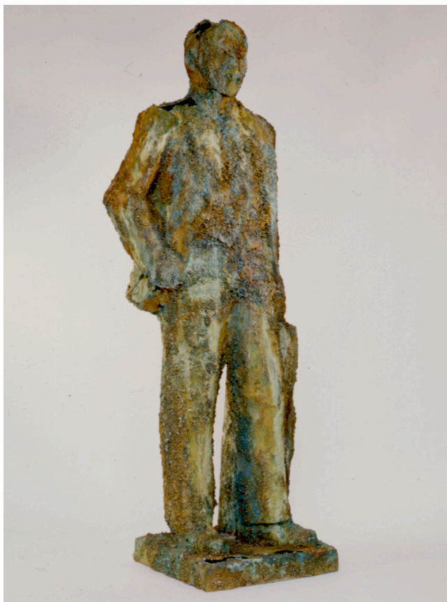
Sic Transit Gloria Mundix , 1997 196 x 70 x 51 cm Collection Arman Marital Trust