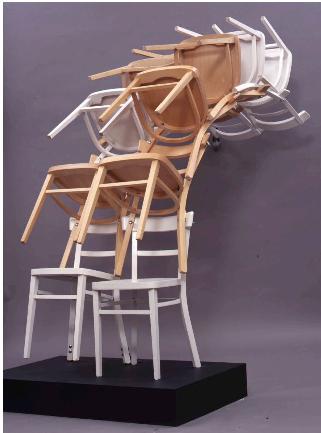
Poulets mal assis , 1999 Accumulation, cascade de chaises en bois 212 x 120 x 234 cm Collection Arman Marital Trust